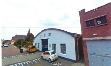
en andere zijde foto 2010