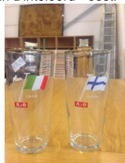
gefotografeerd bij de Meubelboulevard BoZ

Na enkele jaren in Dinteloord gevestigd te zijn vertrok het bedrijf begin de jaren 1970 door een fusie met naamsverandering naar Tilburg.