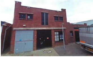
het bedrijfspand aan de Westerstraat te Dinteloord anno 2010

De limonadefabriek is opgericht in 1925 zo wordt aangenomen in het artikel over de Troka in het jaarboek 2013 van de cultuurhistorische vereniging "Nye Aenwas van Nassau" op basis van een krantenartikel in 1965 over het 40 jarig bestaan. Het artikel vermeldt ook dat het doek voor het bedrijf viel in 1974.