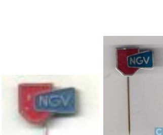
Speldjes en (onder) slogan van de landelijke inkooporganisatie – afkorting van Nederlandse Grossiers Vereniging en opgericht in 1940.

Troka was een limonadegazeuse in het assortiment van groothandel Bruijs – Suijkerbuijk, aangesloten bij de landelijke organisatie NGV (die bestond sedert, aanvankelijk gevestigd in de Van Dedemstraat op nummer 28, nu 188, dat doorliep tot aan de Kloosterstraat, en later aan de Auvergnestraat 28 en 30 te Bergen op Zoom.