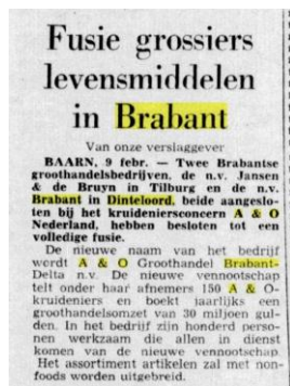
Dagblad voor Nederland 9 februari 1970

Na enkele jaren in Dinteloord gevestigd te zijn vertrok het bedrijf begin de jaren 1970 door een fusie met naamsverandering naar Tilburg.