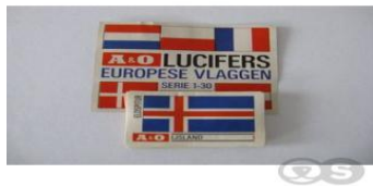
Luciferdoosje van de opvolger van de NGV in 1964 A & O. A&O ging in 1979 op in Markant om na nog wat fusies nu de naam Jumbo te dragen.