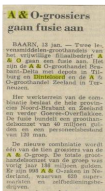
NRC Handelsblad 13 januari 1971

In 1978 werd dat bedrijf, met de naam Brabant Delta, overgenomen door de Jumbo in Veghel (aldus de heer Van Eerd van dat bedrijf in een mail op 3 juni 2016).