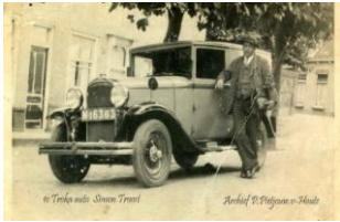
1 ste auto van de fabriek, Opel type B 1.8.

Het magazijn van Troost lag naast de Troka-fabriek aan de Westerstraat in die plaats. Troka was een afkorting van Troost & Kats. Het bedrijf was ook agent van de Amstel-bieren. De achterkant van de Troka – beugelflessen was gesierd met de slagzin: Of de zon schijnt of niet drink Troka limonade en geniet.