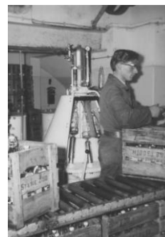
De flessenvulmachine, een gelijke machine stond ook bij de Trokafabriek in Dinteloord