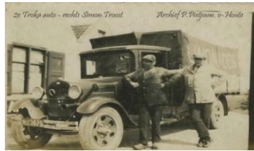
2 e auto van de Troka Ford type A

De foto met de 2 e Troka auto is waarschijnlijk in die straat gemaakt. De huizen achter de auto stonden tegenover de fabriek.