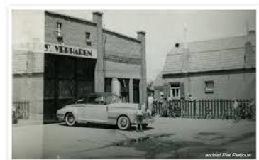
huisvesting in de Westerstraat

Bruis – Suijkerbuijk is later samengegaan met Troost in Dinteloord onder de naam N.V. Brabant. Eerst in de Westerstraat (in twee loodsen) en later in een nieuwbouw in Dinteloord - oost.