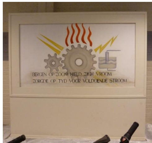
Foto boven: Het inmiddels gesloopte transformatorstation (2012) Foto links midden: Muurschildering van L. Weyts (1949) Foto rechts midden: De ingepakte muurschildering bij De Mooij Fiets en Fitness (2012) Foto linksonder: De muurschildering wordt op hoogte gebracht (8 mei 2015) Foto rechtsonder: De muurschildering is gerestaureerd (22 juli 2015)