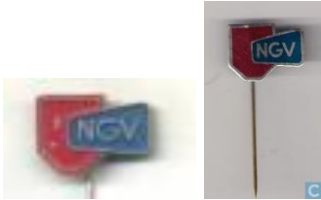
Speldjes en (onder) slogan van de landelijke inkooporganisatie – afkorting van Nederlandse Grossiers Vereniging en opgericht in 1940 -

Troka was een limonadegazeuse in het assortiment van groothandel Bruys – Suijkerbuijk, aangesloten bij de landelijke organisatie NGV (die bestond sedert, aanvankelijk gevestigd in de Van Dedemstraat op nummer 28, nu 188, dat doorliep tot aan de Kloosterstraat, en later aan de Auvergnestraat 28 en 30 te Bergen op Zoom.