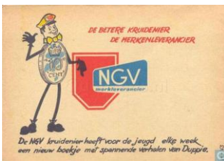
Geplukt van landelijke site