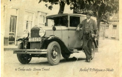
1 ste auto van de fabriek, Opel type B 1.8.

Het magazijn van Troost lag naast de Troka-fabriek aan de Westerstraat in die plaats. Troka was een afkorting van Troost & Kats. Het bedrijf was ook agent van de Amstel-bieren. De achterkant van de Troka – beugelflessen was gesierd met de slagzin: Of de zon schijnt of niet drink Troka limonade en geniet.