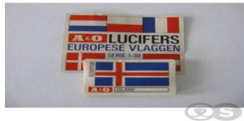
Luciferdoosje van de opvolger van de NGV in 1964 A & O. A&O ging in 1979 op in Markant om na nog wat fusies nu de naam Jumbo te dragen.

Bruys – Suijkerbuijk is later samengegaan met Troost in Dinteloord onder de naam Brabant N.V. Eerst in de Westerstraat (in twee loodsen) en later in een nieuwbouw in Dinteloord - oost. Na enkele jaren in Dinteloord gevestigd te zijn vertrok het bedrijf naar Tilburg en nog later naar Veghel.