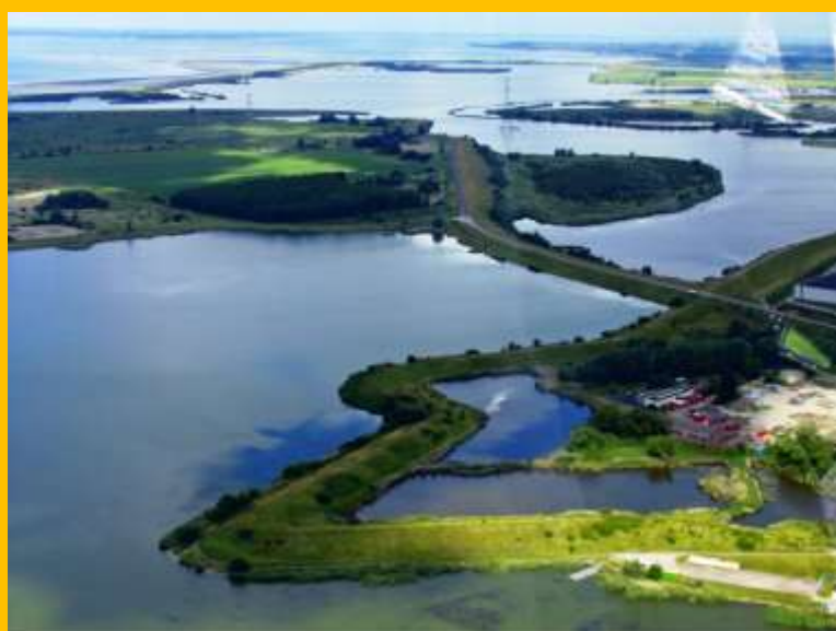
Luchtopname anno 2010 Waterschans ingeklemd tussen Binnenschelde en Noordland. De dam tussen Binnenschelde en Zoommeer leidt naar de Molenplaat

Bergen op Zoom bezit met deze schans een vestingwerk van historisch belangrijke waarde.